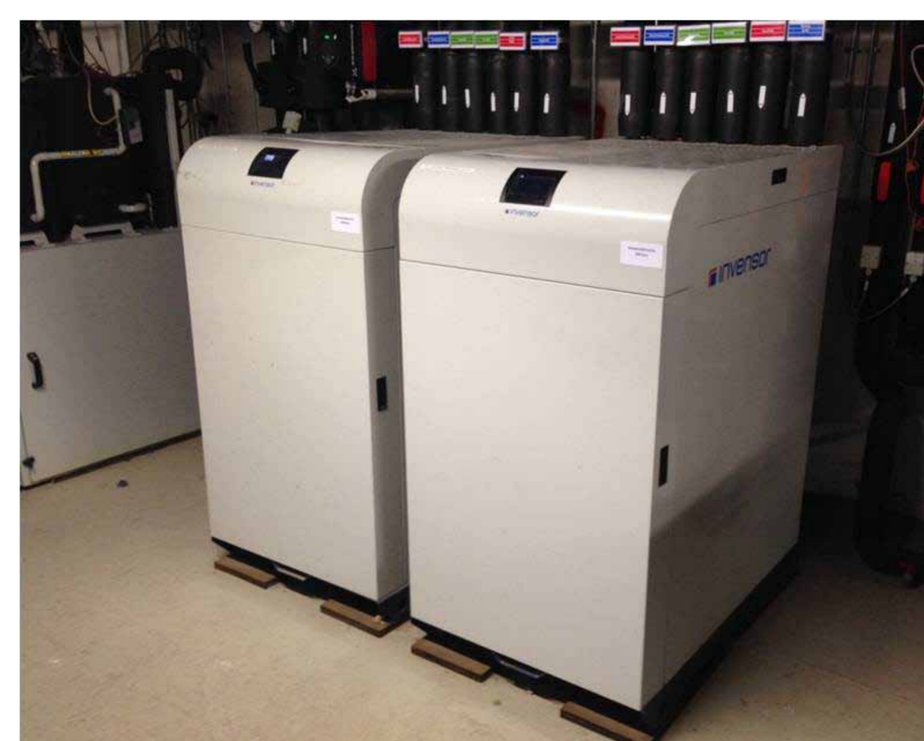
Wärmepumpen für die Abwasserenergienutzung