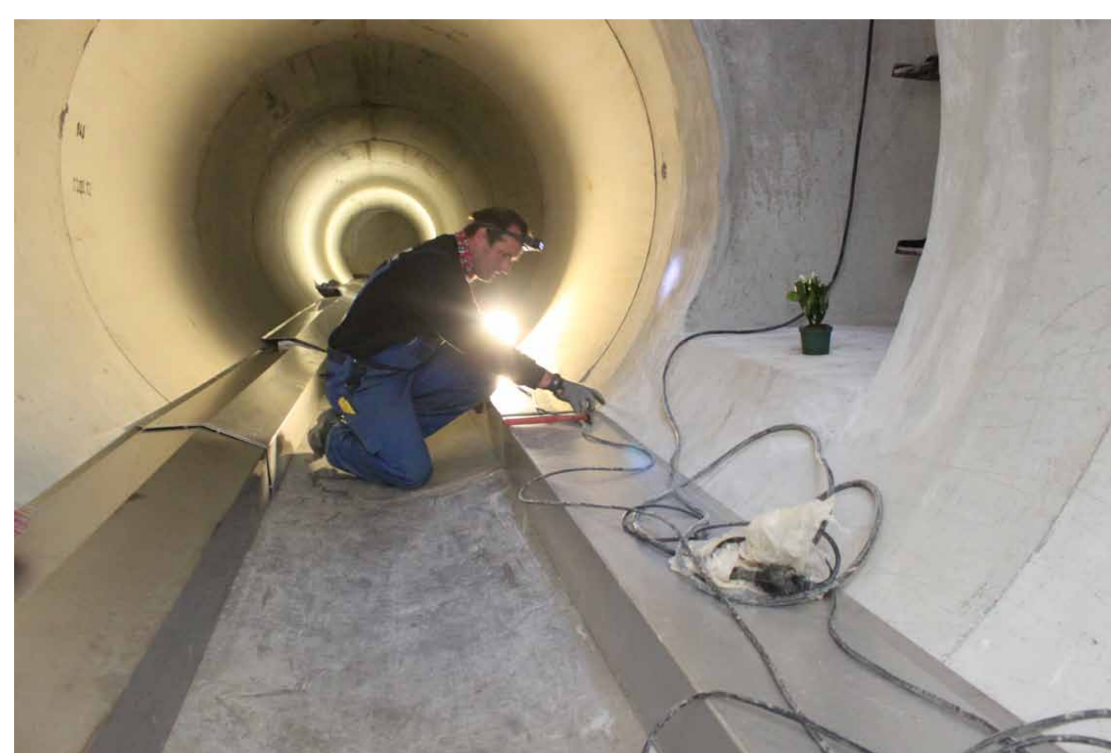
Einbau des Wärmetauschers in den Abwasserkanal